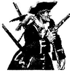
Long John Silver è un immaginario corsaro creato da Robert Louis Stevenson per "L'isola del tesoro"