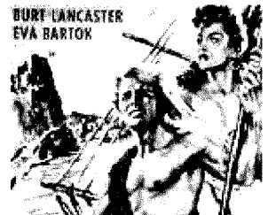
"Il corsaro dell'isola verde" di Robert Siodmak, 1952, è centrato tutto sulle acrobazie di Burt Lancaster