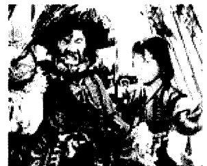
"Pirati" di Roman Polanski, 1986, è un omaggio al filone dei predatori, con un ridondante Walter Matthau