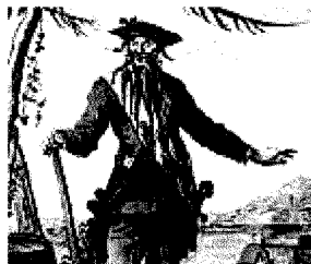
Edward England è un pirata inglese famoso per aver creato l'immagine del teschio con le tibie incrociate