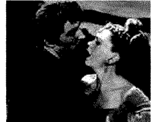
"Il pirata" del 1948 è un musical di Vincente Minnelli con la moglie Judy Garland e Gene Kelly. Imperdibile