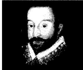
Sir Francis Drake è stato un corsaro per Elisabetta I. Nel 1588 partecipa a travolgere l'Armada spagnola