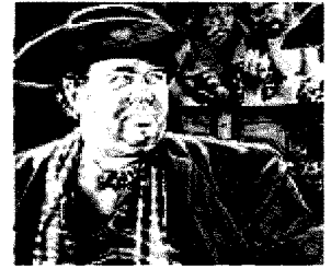
"Capitan Kidd" è un film del 1945 con Charles Laughton, uno dei miti del cinema, su un pirata crudele